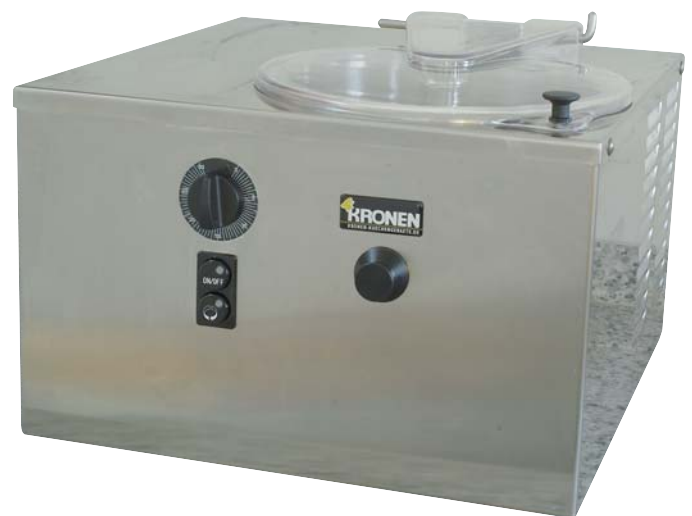
Modell G 5

Alarmlampe für Entnahme bei nicht korrekter Produkttemperatur (nur bei Mod. G10).