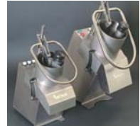
KG-303/403 Die leistungsstarken Gemüseschneider von Kronen

Gemüseschneider. Reiben, raspeln, schneiden. Vom Tischmodell bis zur Standmaschine.