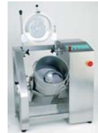
CutStar 40 I Mit 2 Geschwindig- keiten oder stufenlos

Cutter. Vom 2 l-Modell mit 1 Geschwindigkeit bis zum Proficutter mit 40 l.