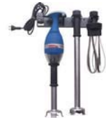
Bermixer B3000 Für Früchte, Cremes, Eismassen u.v.m.

Mixen und rühren. Vom 4 l-Tischmixer über Handmixer bis zum Turbomixer.