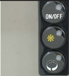
Granité-Schalter, (unten) arbeitet impulsweise