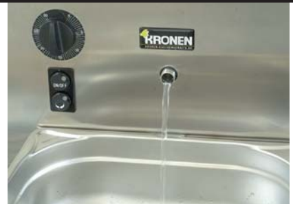
Durchfluss-Reinigungsöffnung für schnelle Reinigung.