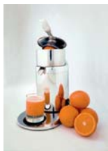
Zitruspresse PI Mit Deckel- automatik

Maschine für frische Säfte. Vom Handgerät bis zur vollautomatischen Maschine.