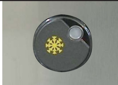
Überwachungsschalter hält Ihr Eis servierbereit. Wird die Temperatur unterschritten und das Eis schmilzt, fängt die Maschine automatisch wieder an zu kühlen => Immer perfekt servierfertiges Eis. Dies ist der Vorteil der Eismaschine G10.