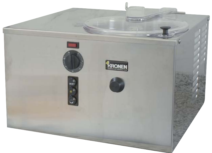
Modell G 10