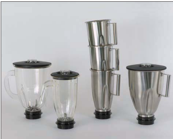
Praktisch und platzsparend: Die Becher sind stapelbar.

Unerreichte Mixeigenschaften in Küche und Bar. Leichte, praxisgerechte Bedie- nung. Ein gutes und überzeugendes Endprodukt.