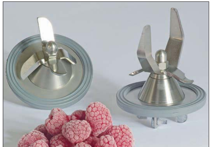
Die Messer sorgen für unerreichte Mixeigenschaften. Messer, Kugellager aus gehärtetem Edelstahl, für lange Lebensdauer. Einfach zu wechseln, hitze- u. kältebeständig. Standard CC-Messer (r.), FD-Messer (l.) für hohe Aufschäumleistung.